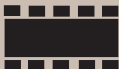
Mødebord op til 40 personer