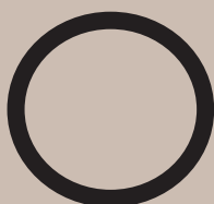
Rundkreds op til 60 personer

I Festsalen er der plads til 150 personer.