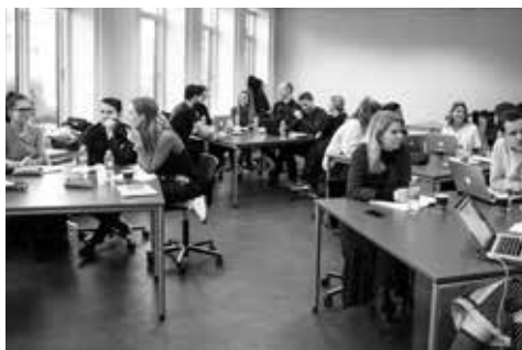
HAP HOLD 3 2017/18