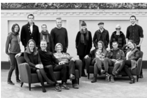
HAP HOLD 1 2015/16