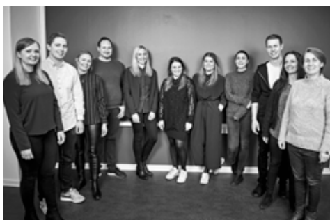
HAP HOLD 2 2016/17