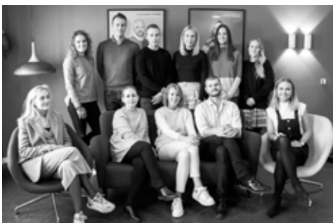
HAP HOLD 4 2018/19